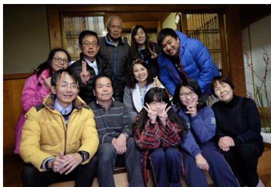
有可愛的日本爺爺奶奶接待的溫暖