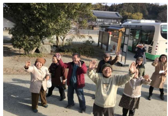
與活力阿公阿嬤告別-期待下次再見面