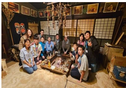
米澤市 homestay 體驗，入住 220 年歷史房屋