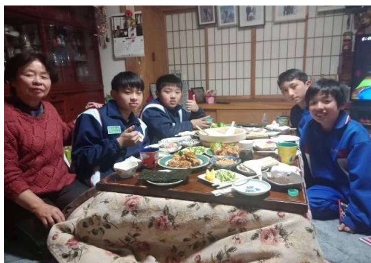
與日本爺爺奶奶享用日式餐