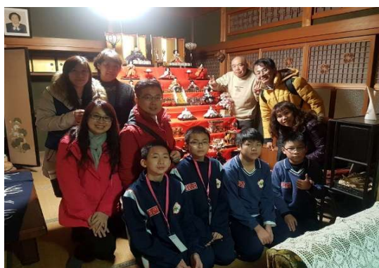
日本阿公阿嬤精心布置「女兒節」接待